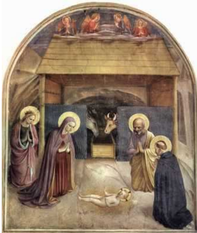
Fra Filippo Lippi: Christi Geburt (1452-1465, Fresko, Florenz)