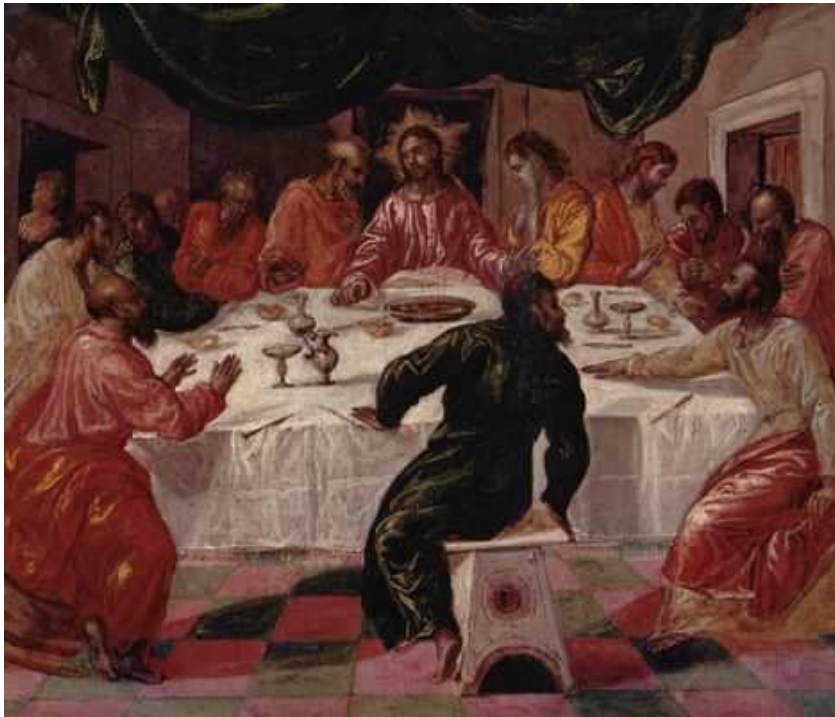
El Greco: Abendmahl 1596, auf Holz 43 x 52 cm