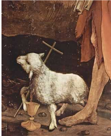
M. Grünewald: Isenheimer Altar 1512 - 1516, Öl auf Holz